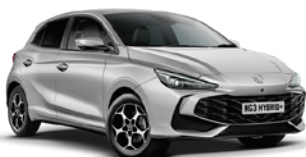
SREBRNY „COSMIC SILVER” (metalik)