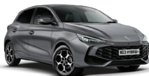
SZARY „HAMPSTEAD GREY” (metalik)