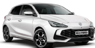
BIAŁY „DOVER WHITE” (standard)