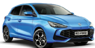
NIEBIESKI „COMO BLUE” (metalik)

Przygotuj się na to, że będziesz przyciągać uwagę.