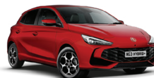
CZERWONY „DIAMOND RED” (trójwarstwowy)