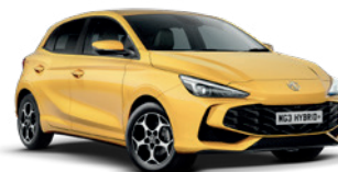
ŻÓŁTY „PASTEL YELLOW” (standard)

* Lakier trójwarstwowy i metaliczny dostępne za dodatkową opłatą.