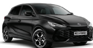
CZARNY „PEBBLE BLACK” (metalik)