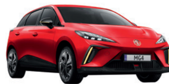
● Czerwony „Diamond Red” trójwarstwowy