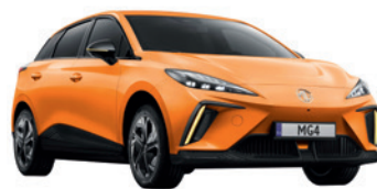
● Pomarańczowy „Fizzy Orange” trójwarstwowy