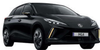
● Czarny „Pebble Black” metalik

Wybierz wariant wyposażenia: Standard, Comfort, Luxury, Luxury Long-Range, XPOWER, i przyciągaj spojrzenia, gdziekolwiek pojedziesz.