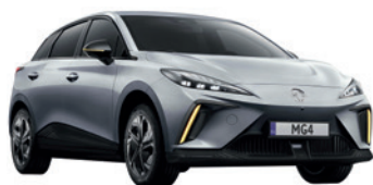
● Srebrny „Medal Silver” metalik