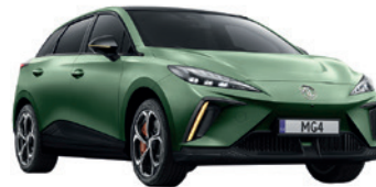
● Zielony „Hunter Green” matowy