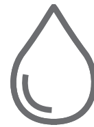
Zużycie paliwa 7,4-7,6 l/100 km